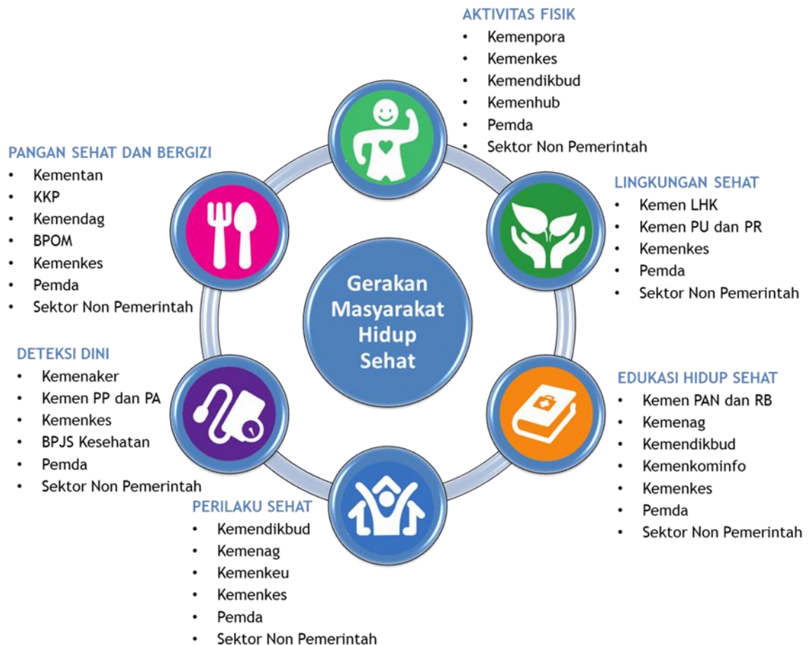
Gambar 3.3: Peran Lintas Sektor dalam Germas

Pada pelaksanaan Germas, kegiatan edukasi atau upaya promosi yang dilakukan dengan memperhatikan ketiga faktor, berdasarkan ruang lingkup Germas, mengacu pada indikator Perilaku Hidup Bersih dan Sehat (PHBS) dan indikator Keluarga Sehat (KS) maka perubahan perilaku sehat yang diharapkan dibagi dalam 4 kelompok yaitu perubahan perilaku individu, perubahan perilaku keluarga, perubahan perilaku komunitas/masyarakat dan perubahan perilaku institusi.