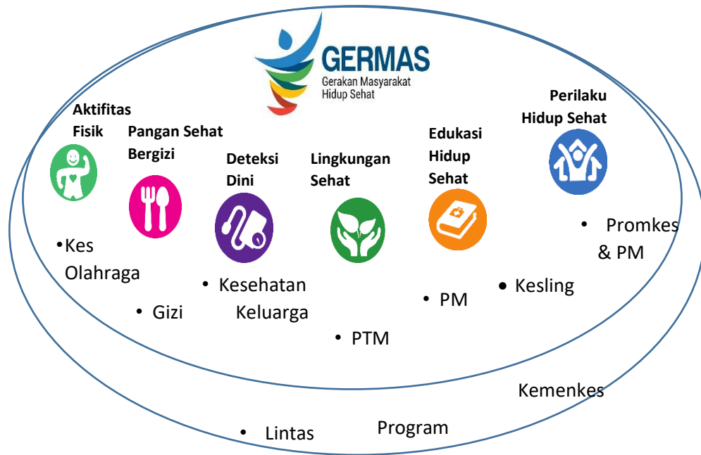
Gambar 3.2: Peran Lintas Program dalam GERMAS

Tindakan dan interaksi yang sistematis, dinamis dan terencana yang dilakukan secara bersama-sama oleh lintas program dan lintas sektor untuk meningkatkan kesadaran, kemauan, dan kemampuan berperilaku sehat masyarakat sehingga derajat kesehatan masyarakat meningkat yang pada akhirnya akan meningkatkan kualitas hidup manusia. Gambaran interaksi yang dinamis antar lintas program dan lintas sektor dapat dilihat pada Gambar 3.2 dan gambar 3.3 berikut ini: