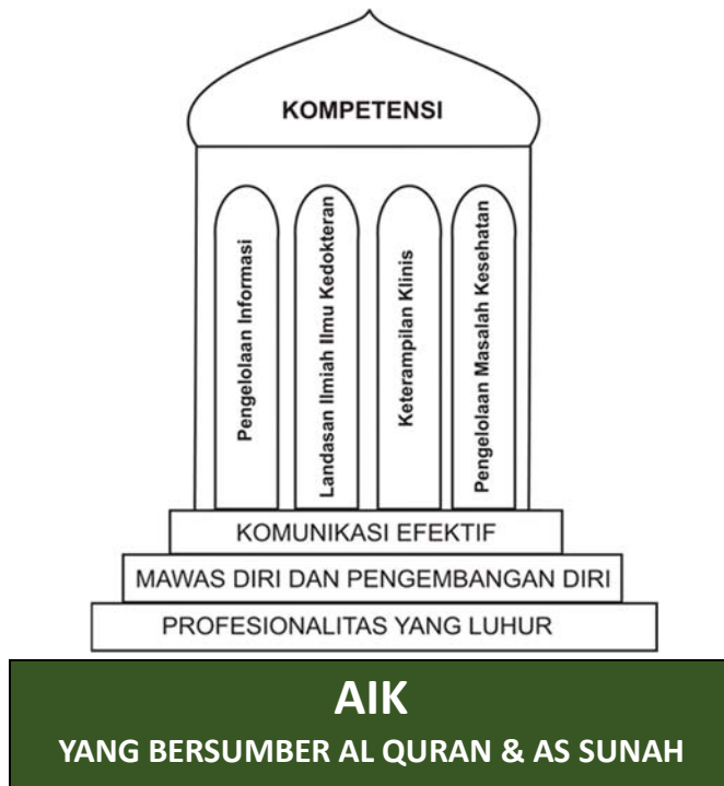
Gambar 2 Skema Standar Kompetensi Dokter Muhammadiyah

Secara skematis, Standar Kompetensi Dokter Muhammadiyah digambarkan sebagai berikut: